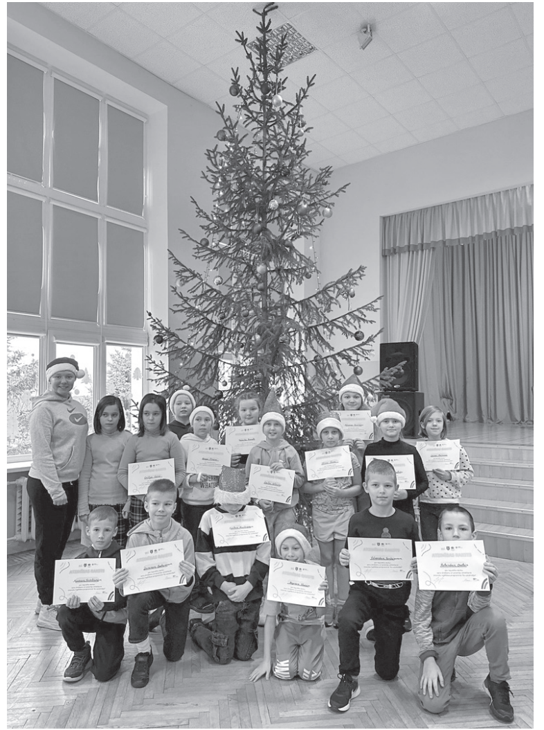
2. attēls no Krāslavas BJC foto materiāliem. (Pulciņa „Es - uzņēmējs” 1.-4. klašu vecumposma noslēguma nodarbība 2023. gada decembrī.).

dažādu profesiju pārstāvjiem, piedalās labdarības akcijās, mācās rakstīt un īstenot projektus. Jaunieši vāca ziedojumus Turcijā 2023. gada notikušajā zemestrīcē cietušajiem. Piedalījās Krāslavas novada pašvaldības izsludinātajā jauniešu iniciatīvu konkursā, uzrakstīja un īstenoja projektu „Darot kopā, varam mainīt!”.