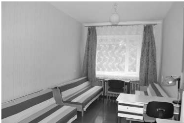
Valsts immn zijas intern ts, Ingas Kavinskas foto

Par ieguld jumu, sagatavojot iest di 2012./2013.m c bu gadam, PII „Pienen te” un Gr.Pl teru v.n. Kr slavas Po u pamatskolas kolekt vi sa ma Kr slavas novada domes d vanu kartes. Par šiem l - dzek iem „Pienen tes” kolekt vs pl no nopirkt jaunu pakl ju aktu z lei, bet Po u pamatskola d vanu