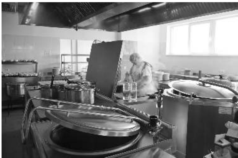
Varav ksnes vidusskolas virtuve

Intern t ir veikts kosm tiskais remonts, istab s par d j s jaunas m beles, ledusskapji, virtuv - elektropl ts, mikrovi u kr sns, jaunas virtuves m beles. Esam p rliecin ti, ka intern ta iem tnieki iecien s plaukti us, kas atrodas gaiten , tajos ir rti ž v t apavus. Bez šaub m, intern ta telpas k uva est tisk kas un m j g kas.