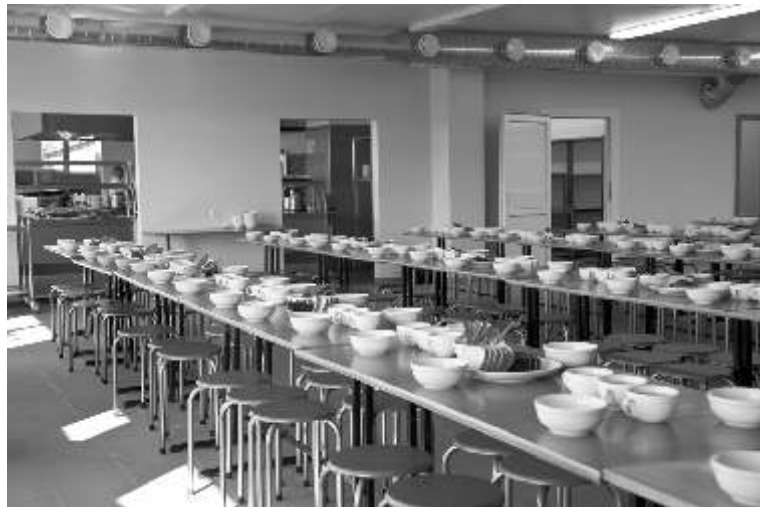
Varav ksnes vidusskolas damz le

- K di jaunumi gaid ja Kr slavas pamatskolas audz k us?